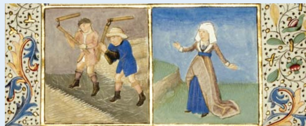
Projet graphique: www.tipografiacarnicella.com